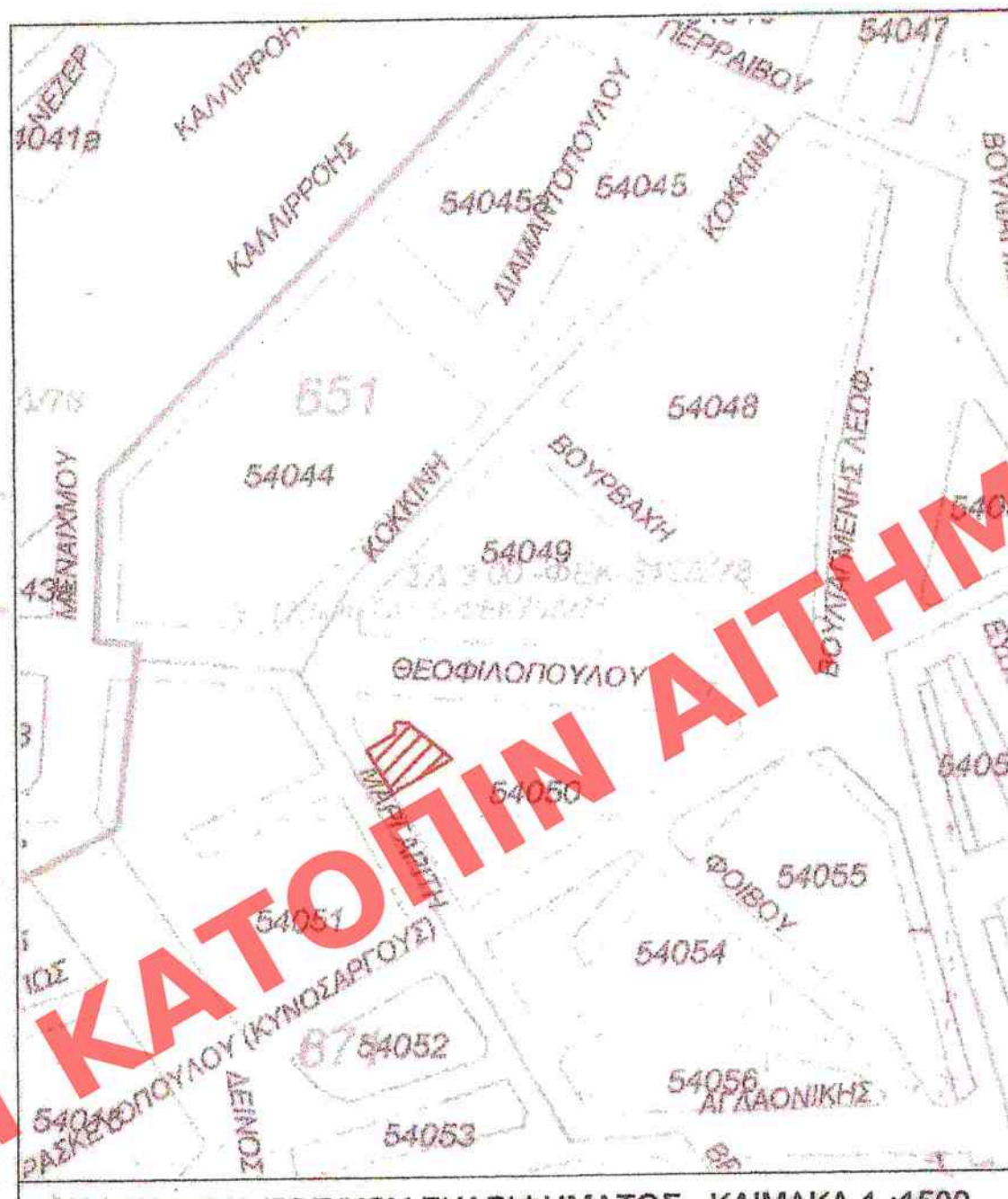
ΑΠΟΣΠΑΣΜΑ ΤΟΠΙΚΟΥ ΣΧΑΡΙΦΗΜΑΤΟΣ - ΚΛΙΜΑΚΑ 1 : 1500