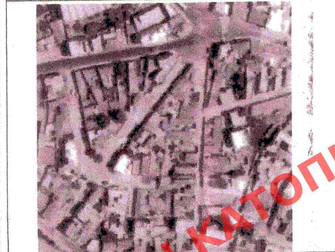
ΑΕΡΟΦΩΤΟΓΡΑΦΙΑ 62. 919658 / 10-08-1962