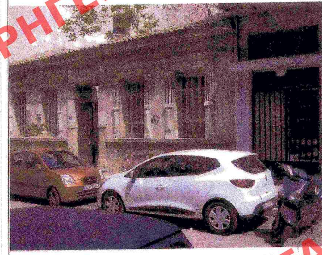
ΘΕΣΗ ΦΩΤΟΛΗΨΙΑΣ 2